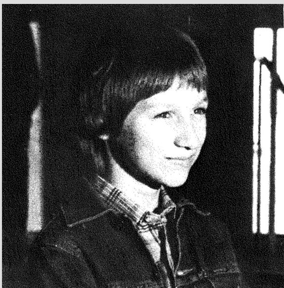
Abbildung 3: 1980: erster Junge an der Ricarda-Huch-Schule

Um den Schülern einen vielfältigen Unterricht zu bieten wurden 1969 Klassengemeinschaften in den Oberstufen abgeschafft. In den 1980ern wurden nun Jungen und Mädchen gemeinsam unterrichtet wurden. Außerdem wurde zwei Jahre nach dem die ersten Jungen an die Schule kamen, eine Fußballmannschaft der Ricarda-Huch-Schule gegründet.