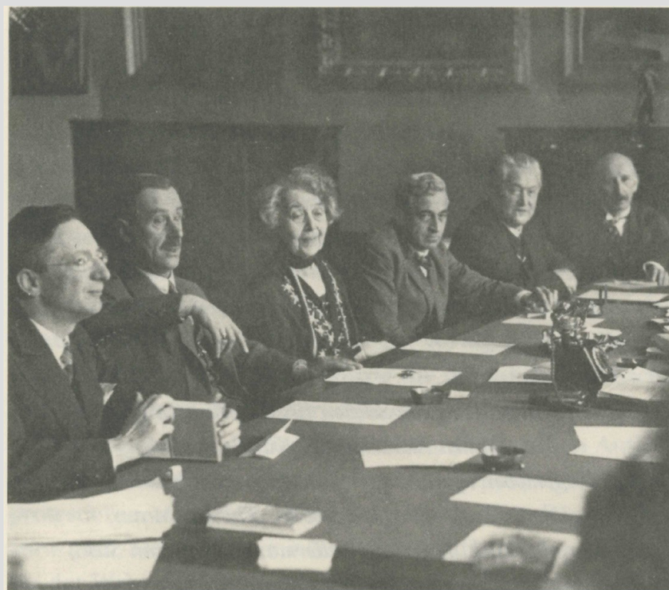
Abbildung 2: Ricarda Huch als einzige Frau in der Preußischen Akademie der Künste in Berlin

Ricarda Huch war 1933, zu Beginn des „dritten Reichs“, schon fast 70 Jahre alt. Die Ideologie der Nazis passte nicht in ihr Bild von Deutschland und ihr großes Bedürfnis nach Freiheit. Darum wendete sie sich in dieser Zeit gegen die Regierung und kooperierte nie mit ihr, sie hatte wie schon erwähnt ein Problem mit der fehlenden Freiheit und auch mit dem unverständlichen Hass auf Juden und ihre Deportation in Arbeits- und Vernichtungslager. 1933 trat sie deswegen auch aus der Preußischen Akademie der Künste aus, da für eine Mitgliedschaft erforderlich wurde, zu versprechen sich nicht öffentlich kritisch gegen die Politik zu äußern.